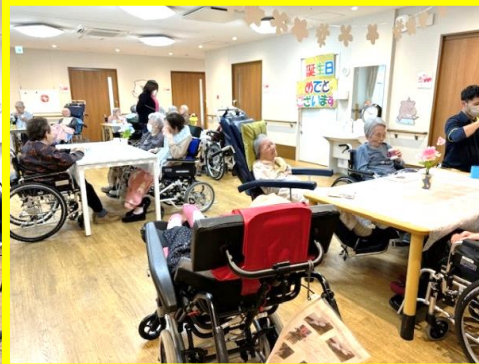
つつじ・やまぶきユニットにて、お誕生日会が行われました！