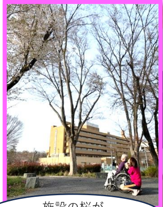
施設の桜が咲きました