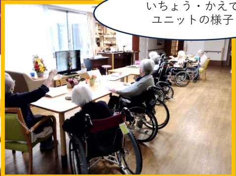
いちょう・かえでユニットの様子